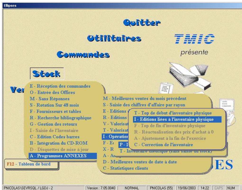
Fig.2 : Comment accéder à l'édition Monory

Puis il faut faire le choix n° 6 (Fig.3) en se positionnant dessus avec les flèches et en appuyant sur E pour une visualisation à l'écran ou I pour l'impression.